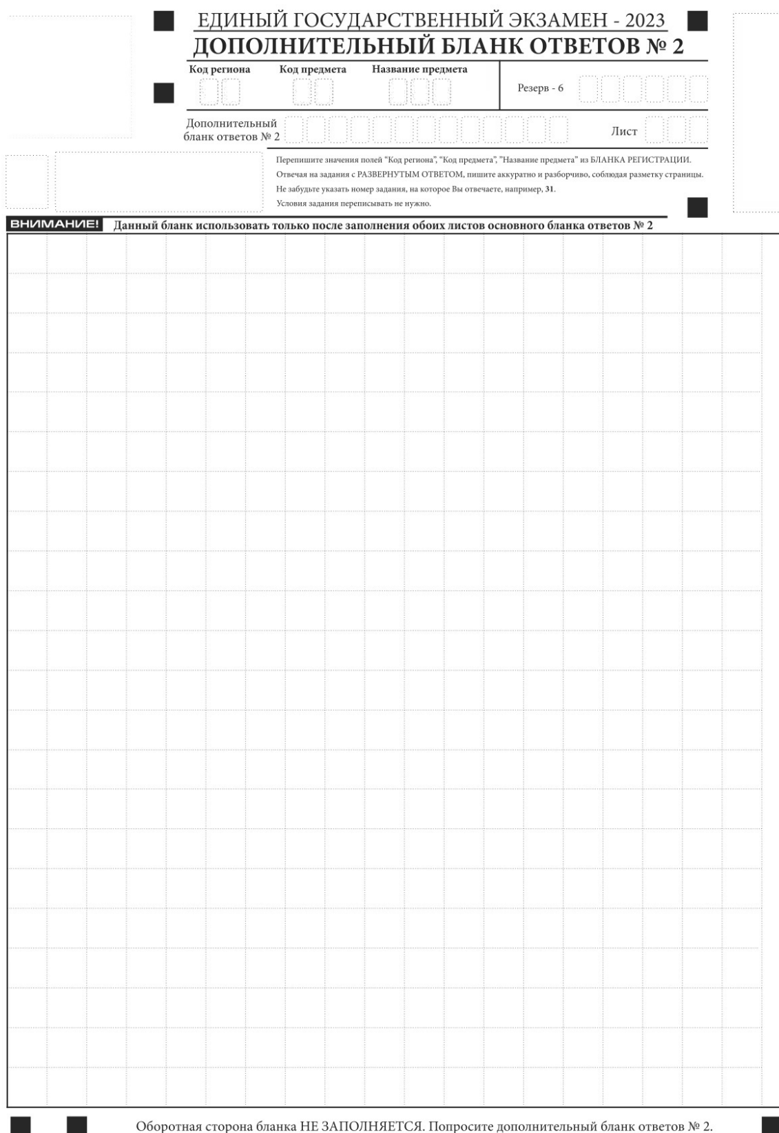
Рис. 20. Дополнительный бланк ответов № 2 ЕГЭ по китайскому языку

Дополнительный бланк ответов № 2 (рис. 19) выдается