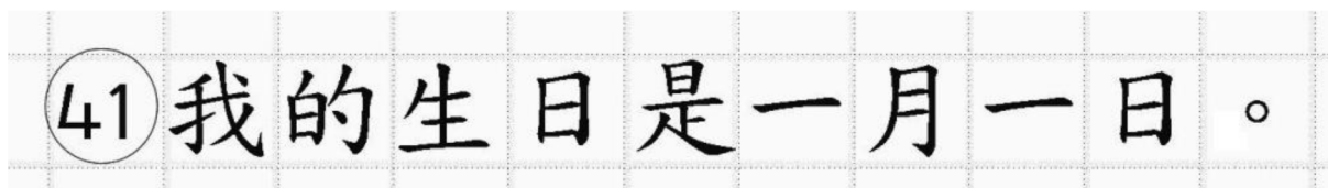
Рис.18. Образец написания иероглифических знаков

Бланк ответов № 2 (лист 1 и лист 2) по китайскому языку (рис. 16 и рис. 17) предназначен для записи ответов на задания с развернутым ответом по китайскому языку (строго в соответствии с требованиями инструкции к КИМ ЕГЭ и к отдельным заданиям КИМ ЕГЭ). Каждый иероглифический знак и каждый знак препинания следует писать внутри отдельной клетки в поле ответов бланка ответов № 2 (дополнительного бланка ответов № 2) (рис. 18).